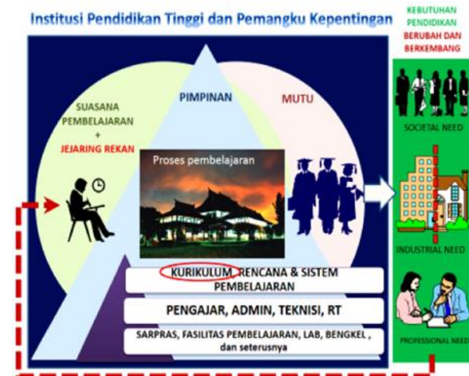
Gambar 1.1 Alur Sistem Pendidikan Tinggi

Setelah melalui proses pembelajaran yang baik, diharapkan akan dihasilkan lulusan PT yang berkualitas. Beberapa indikator yang sering digunakan untuk menilai keberhasilan lulusan PT adalah (1) IPK; (2) Lama Studi dan (3) Predikat kelulusan yang disandang. Namun proses ini tidak hanya berhenti disini. Untuk dapat mencapai keberhasilan, perguruan tinggi perlu menjamin agar lulusannya dapat terserap di pasar kerja. Keberhasilan PT untuk dapat mengantarkan lulusannya agar diserap dan diakui oleh pasar kerja dan masyarakat inilah yang akan juga membawa nama dan kepercayaan PT di mata calon pendaftar yang akhirnya bermuara pada peningkatan kualitas dan kuantitas pendaftar (input). Siklus ini harus dievaluasi dan diperbaiki atau dikembangkan secara berkelanjutan (Gambar 1.1)