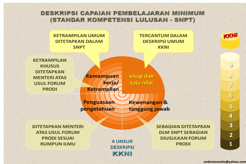
Gambar 1.5 Capaian Pembelajaran Sesuai KKNi

Apabila unsur-unsur pada CP tersebut dijadikan bahan utama dalam penyusunan kurikulum pada program studi, maka lulusannya akan dapat mengonstruksi dirinya menjadi pribadi yang utuh dan unggul dengan karakter yang kuat dan bersih.