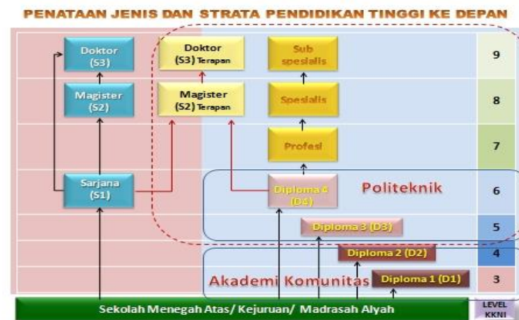
Gambar 1-4 Penataan Jenis dan Strata Pendidikan Tinggi

jenjang 9 tertinggi. Setiap jenjang KJNI berespadan dengan level Capaian Pembelajaran (CP) program studi pada jenjang tertentu, yang mana kesepadannya untuk pendidikan tinggi adalah level 3 untuk D1, level 4 untuk D2, level 5 untuk D3, level 6 untuk D4/S1, level 7 untuk profesi (setelah sarjana), level 8 untuk S2, dan level 9 untuk S3.