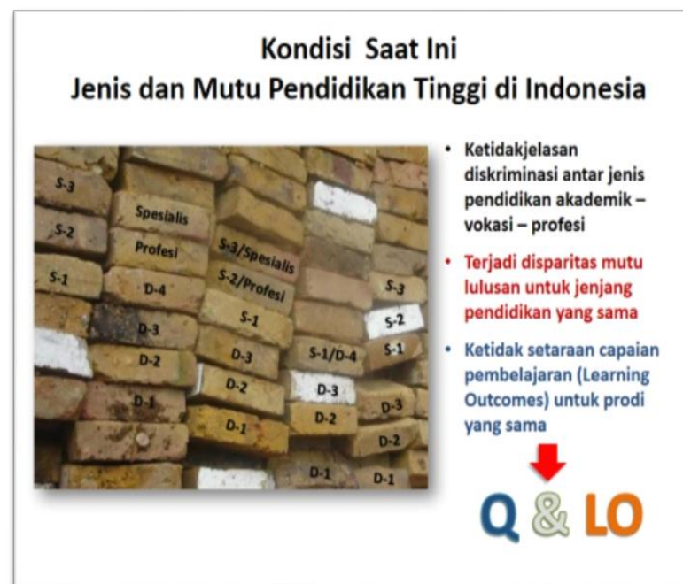
Gambar 1.2 Ilustrasi Disparitas Capaian Pembelajaran Pendidikan Tinggi Indonesia

Selain alasan tuntutan paradigma baru pendidikan global di atas, secara internal, kualitas pendidikan di Indonesia sendiri, terutama pendidikan tinggi memiliki disparitas yang sangat tinggi. Antara lulusan S1 program studi satu dengan yang lain tidak memiliki kesetaraan kualifikasi, bahkan pada lulusan dari program studi yang sama. Selain itu, tidak juga dapat dibedakan antara lulusan pendidikan jenis akademik, dengan vokasi dan profesi. Carut marut kualifikasi pendidikan ini membuat akuntabilitas akademik lembaga pendidikan tinggi semakin turun. Di bawah ini terdapat ilustrasi gambar yang dapat memberikan analogi terhadap rendahnya akuntabilitas akademik pendidikan tinggi di Indonesia